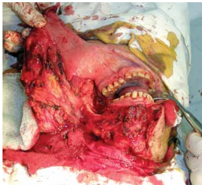
Рис. 1. Вид операционной раны по окончании резекционного этапа вмешательства – выполнено удаление опухоли слизистой оболочки правой ретромолярной области с краевой резекцией внутреннего угла нижней челюсти, фасциально-футлярное иссечение клетчатки шеи

В основу данной статьи положены клинические наблюдения за пациентами, которые были оперированы в ГБУЗ НО «Нижегородский областной онкологический диспансер», филиал №1 (до 2010 г. – ГУЗ НО «Онкологический диспансер города Нижнего Новгорода») в период с 2005 по 2014 г. Предлагаемая техника использована в ходе комбинированных операций по поводу плоскоклеточного рака слизистой оболочки ретромолярной области, сопровождавшихся краевой резекцией нижней челюсти с площадью дефекта слизистой оболочки не более 20 см 2 . Другими словами, выполнены органосохраняющие операции без нарушения непрерывности дуги нижней челюсти без формирования значительного дефекта эпителиальной поверхности и без выраженного дефицита мягких тканей (рис. 1). Также следует отметить невозможность укрытия пострезекционного дефекта местными тканями