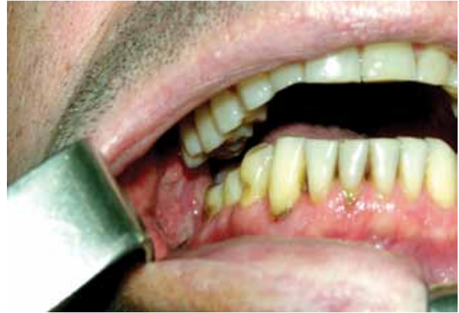
Рис. 6. Вид лоскута в полости рта через 1 год после операции. Развитие тризма связано с резекцией медиальной крыловидной мышцы в ходе операции с последующим рубцеванием тканей подвисочной ямки