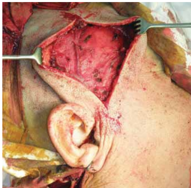
Рис. 2. После сепаровки кожи от поверхностной фасции видна передняя поверхность лоскута

Границами для лоскута являются: снизу — скуловая дуга, вверх лоскут можно при потребности в большей площади продлить до верхней височной линии, к которой прикрепляется височный апоневроз. Описываются случаи с увеличением донорской зоны до сагитального шва. В стороны границы лоскута могут достигать