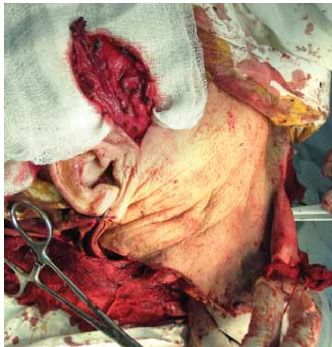
Рис. 3. Височный фасциально-апоневротический лоскут отделен от подлежащих тканей в донорской зоне. Состояние перед формированием тоннеля для транспозиции лоскута в полость рта

Со стороны полости рта тоннель начинается на границе укрываемого дефекта и сохраненной слизистой оболочки щеки. При этом удобно наметить направление тоннеля бимануально, сводя между собой пальцы, проводимые в указанном направлении.